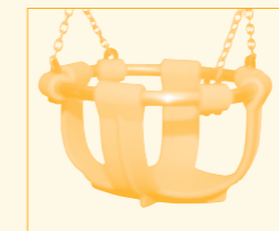
Potseat. Geschikt voor T for 2 en voor Kleuterschommel.